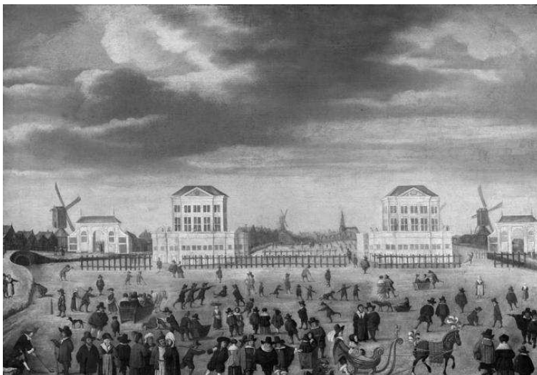
Afb. 1 De blokhuisen in de Amstel in de winter , ca 1651-54 Onbekend Olieverf op doek, 83 x 119 cm Inv.nr. SA 3010

Als eerste werd gezien een schilderij in het depot (afb. 1) waarvan de maker onbekend is en die door Carasso een ‘zeventiende eeuwse zondagsschilder’ is genoemd. 6 Vervolgens heeft de werkgroep het schilderij van Hendrik Dubbels (1621-1707) bekeken dat tot de vaste collectie behoort (afb. 2). Het zijn beide riviergezichten in de winter, afgebeeld met een dichtgevroren Amstel en op het ijs talloze figuren die allerlei activiteiten uitoefenen. Het depotschilderij is groot (83 x 119 cm) en de blokhuisen zijn centraal en symmetrisch ten opzichte van elkaar gepositioneerd. De huizen zijn op een bijna brutale wijze neergezet met op de voorgrond een paar rijen kleurrijke figuren waarvan het lijkt alsof die nauwelijks enig verband hebben met de blokhuisen die achter hen zijn afgebeeld.