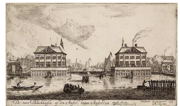
Prent Reinier Nooms Afbeeldingsbestand: 010001000126