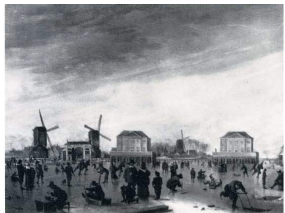
Afb. 3 Links: ijsvermaak, de onechte Jan van Goyen (bron: B. Haak 1966/67 pp. 10-14); rechts: het schilderij van Hendrik Dubbels in het Amsterdam Historisch Museum.