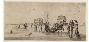
Prent Afbeeldingsbestand: 010097004697