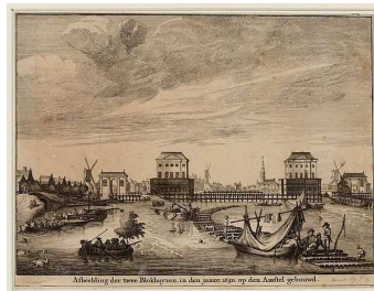
Prent Afbeeldingsbestand: 010097004699