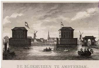
Prent Afbeeldingsbestand: 010097004695