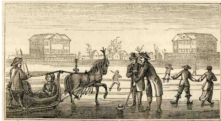
Afb.7 IJsvermaak op de Amstel voor de blokhuisen.