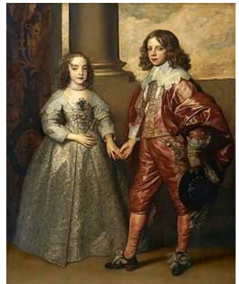
Afb. 4 De latere stadhouder Willem II en zijn bruid Maria Stuart , 1641 Anthony van Dyck (1599-1641) olie op doek, 182,5 x 142 cm Rijksmuseum

Willem's vader Frederik Hendrik had leiding gegeven aan de onderhandelingen die een einde maakten aan de Tachtigjarige Oorlog. Echter voordat de vrede van Munster getekend kon worden, werd hij ernstig ziek. Na