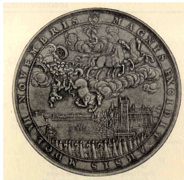
Afb. 6 Gedenkpenning op Prins Willem II door Sebastiaen Dadler.

OVERVAL Beschrijving voorzijde: 't Wapen van Amsterdam bovenaan in 't midden van de rand. Het randschrift CRIMINE AB UNO DISCE OMNEIS. MDCL. XXX IULII is een citaat uit Virgilius' Aeneas II, 65-66, gevolgd door de datum van de aanslag op Amsterdam. Het citaat betekent: 'aan één zo'n misgreep kunt ge ze allen kennen'. Beneden tegen de rand het onderschrift QUIA BELLA VETABA, ontleend aan Aeneas II, 83. Het betekent: 'omdat [Amsterdam] zich verzette tegen de oorlog'. Het hollende paard in de morgenstond vóór de Amstel beheerst de voorstelling