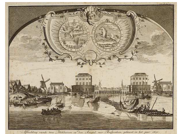
Prent Bernard Picart Afbeeldingsbestand: 010097011911