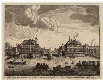
Prent Afbeeldingsbestand: 01009004696