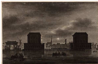
Afbeeldingsbestand: 010097001944