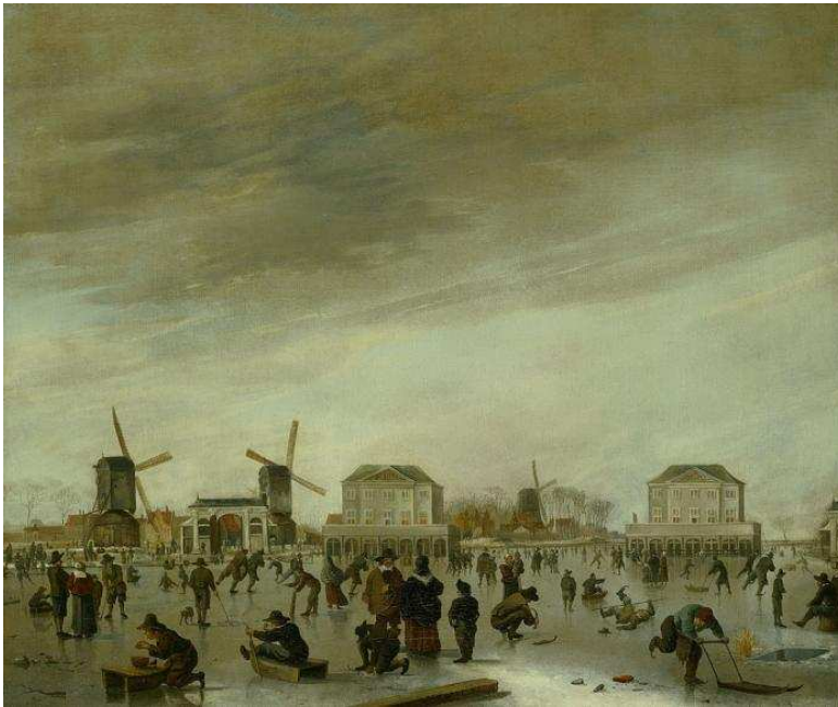
Afb. 2 De blokhuisen in de Amstel bij winter , ca 1651-54 Hendrick Dubbels (ca. 1621-1707) Olieverf op doek, 47,5 x 56 cm Inv.nr. SB 4521

achterover gevallen. Anderen zijn aan het colfspelen, terwijl overal op de ijsvlakte toeschouwers het vermaak staan te bekijken. Links op de voorgrond zit een man