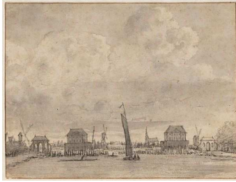
Tekening Roelant Roghman