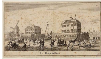
Prent Afbeeldingsbestand: 010097004698